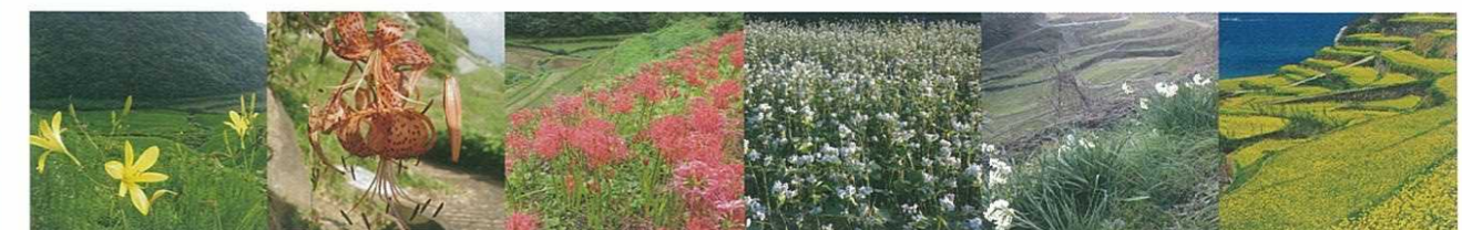
●7月初旬 ユウスゲ ●7月末 オニユリ ●9月中旬 彼岸花 ●10月末 ソバ ●1月末 水仙 ●3月末 菜の花