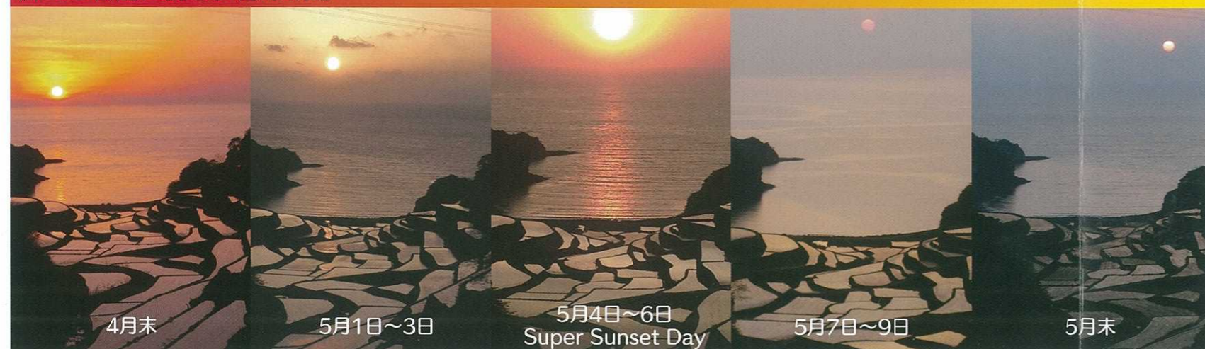
4月末 5月1日～3日 5月4日～6日 Super Sunset Day 5月7日～9日 5月末