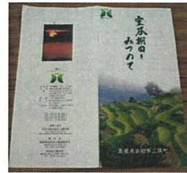
パンフレットの作成 (浜田市 室谷)