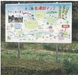
棚田周辺マップの設置 (大田市 子ご美の里)