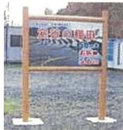
案内看板の設置 (浜田市 室谷)