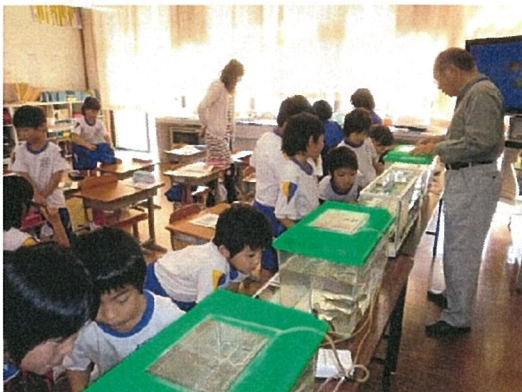
（写真1）小学校での観察学習