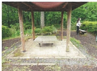
展望台東屋の補修 (吉賀町 大井谷)