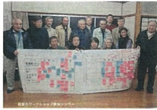
ワークショップの開催 (雲南市 山王寺)