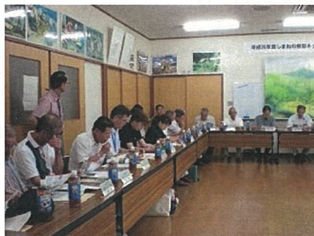
（写真2）棚田ネットワーク情報交換会