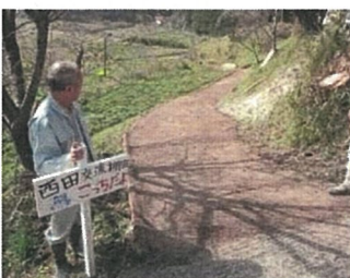
散策道の整備 (大田市 ヨズクの里)