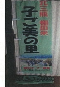
イベント用幟の製作 (大田市 子ご美の里)