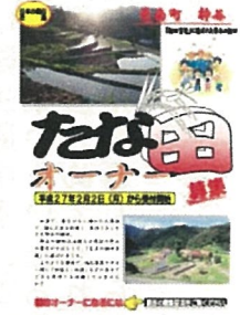
オーナー募集チラシ (邑南町 神谷)