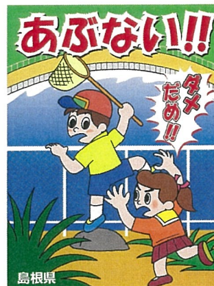
（写真2）ため池啓発看板