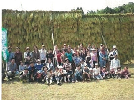
（写真1）山王寺 たんぼの学校