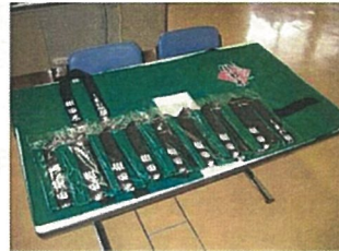
イベント用法被の製作 (邑南町 羽須美)