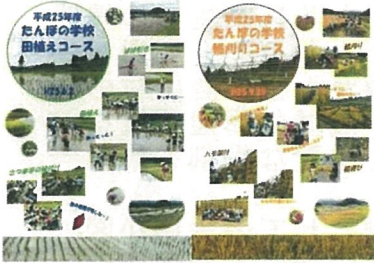
田んぼの学校活動支援 (雲南市 山王寺)