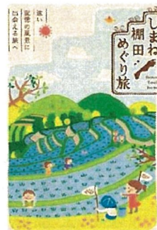
棚田パンフレットを 作成し情報を発信