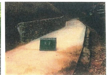
オーナー耕作道路の補修 (吉賀町 大井谷)