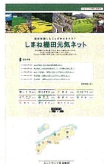
ホームページによる 活動情報等の発信