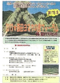
ヨズクの里フォーラム開催 (大田市 ヨズクの里)