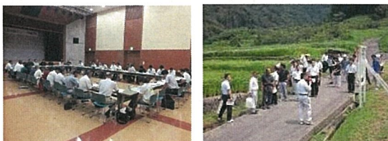
情報交換会の様子