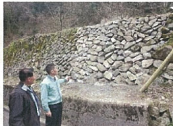
棚田石垣の補修 石積み手順書の作成 (吉賀町 大井谷)