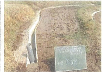
オーナー田湧水路整備 (雲南市 山王寺)