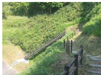
展望台階段、手摺の補修 (吉賀町 大井谷)