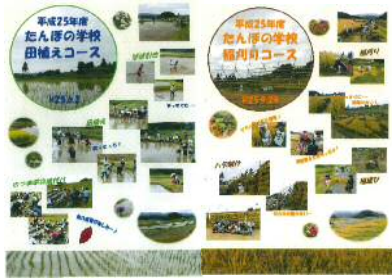
田んぼの学校活動支援 (雲南市 山王寺)