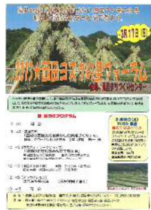
ヨズクの里フォーラム開催 (大田市 ヨズクの里)