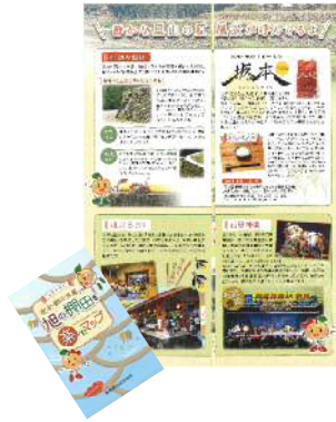
パンフレットの作成 (浜田市 旭)