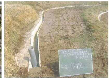
オーナー田湧水路整備 (雲南市 山王寺)