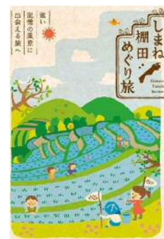
棚田パンフレットを作成し情報を発信