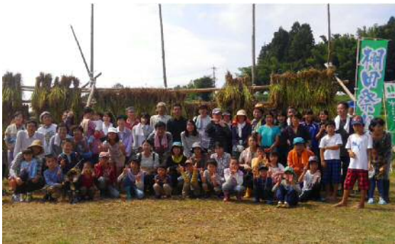
（写真1）山王寺 たんぼの学校