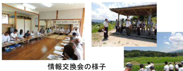
情報交換会の様子