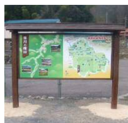
案内看板の設置 (浜田市 都川)