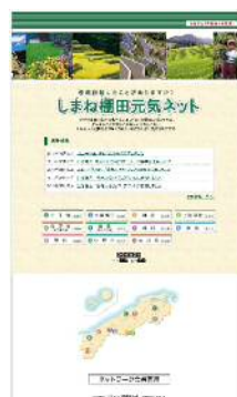
ホームページによる活動情報等の発信