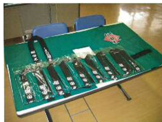
イベント用法被の製作 (邑南町 羽須美)