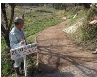
散策道の整備 (大田市 ヨズクの里)