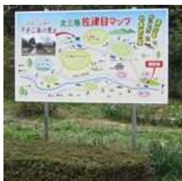
棚田周辺マップの設置 (大田市 子ご美の里)