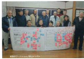
ワークショップの開催 (雲南市 山王寺)