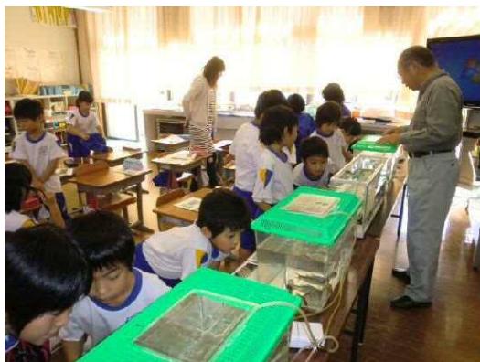
（写真1）小学校での観察学習