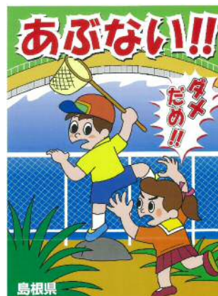
（写真2）ため池啓発看板