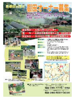
オーナー募集チラシ (邑南町 上田)