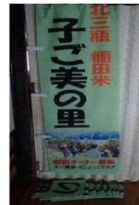
イベント用幟の製作 (大田市 子ご美の里)