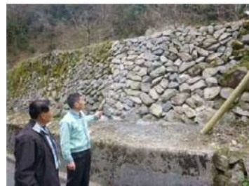
棚田石垣の補修 石積み手順書の作成 (吉賀町 大井谷)