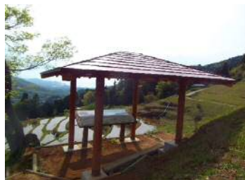
展望台東屋の整備 (浜田市 室谷)