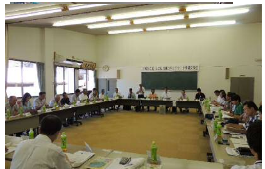
（写真2）棚田ネットワーク情報交換会