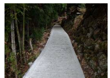
散策道路修繕 (浜田市 室谷)